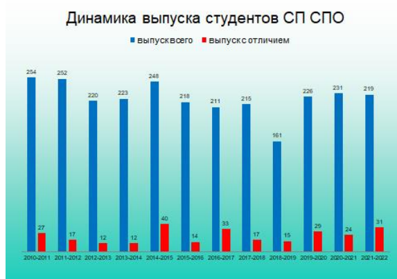
Рис. 1. Динамика выпуска студентов СП СПО

В 2023 году состоится первый выпуск студентов заочной формы обучения структурного подразделения высшего образования (СП ВО) специальностей 23.05.04 Эксплуатация железных дорог и 23.05.06 Строительство железных дорог, мостов и транспортных тоннелей.